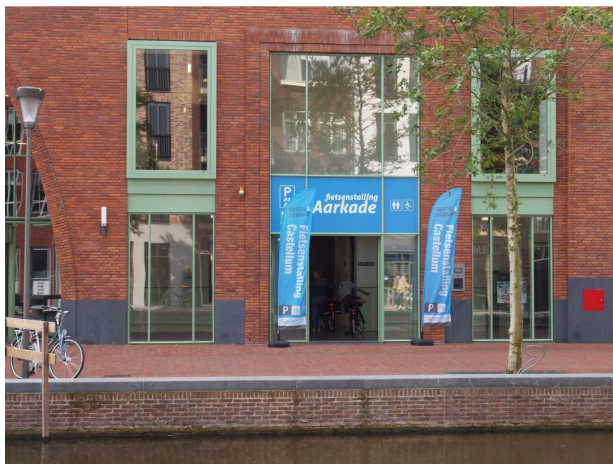
Beachflags voor de ingang van de stalling.

Aan de Aarkade in Alphen aan den Rijn, naast de bibliotheek ligt een prachtige overdekte fietsenstalling. Fijn voor de fietsers en mooi voor het personeel. De locatie is ook niet verkeerd hoewel de oude locatie op het Aarplein beter was want vlakbij de AH. Een probleem is wel dat de stalling minder in het oog loopt. Er zijn nu twee vlaggen neergezet. Dat kan helpen. Toch stikt het nog steeds van fietsen die zijn gestald op de Aarkade, het bruggetje bij de Van Mandersloostraat en andere plekken. Komt dat omdat de stalling vol staat? Nee dus.