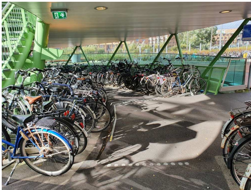
Fietsen in de Fietsappel.

Het is onze gewoonte om in de herfst te tellen hoeveel fietsen er geparkeerd staan in de onbewaakte stallingen bij station Alphen aan den Rijn. Om te zien of de capaciteit van de stallingen wel voldoende is. Vorig jaar konden we duidelijk het effect van de coronacrisis zien: mensen werkten of studeerden thuis. Er stonden dan ook veel minder fietsen dan een jaar eerder.