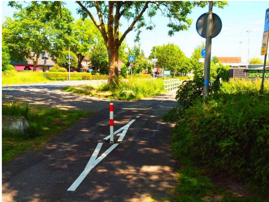
Belijning attendeert nu op paaltje in fietspad bij Zevenhoven.