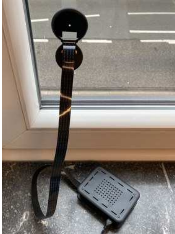
Een telraam.

De analyse van Telraam maakt gebruik van de grootte en de snelheid van het passerende object, wat tot enkele benaderingen kan leiden. Vanwege zijn grootte zal Telraam bijvoorbeeld een tram als een vrachtwagen tellen. Bestelwagens kunnen, afhankelijk van hun grootte, als vrachtauto of als personenauto worden geteld. Bussen worden vanwege hun grootte ook als vrachtauto geteld.