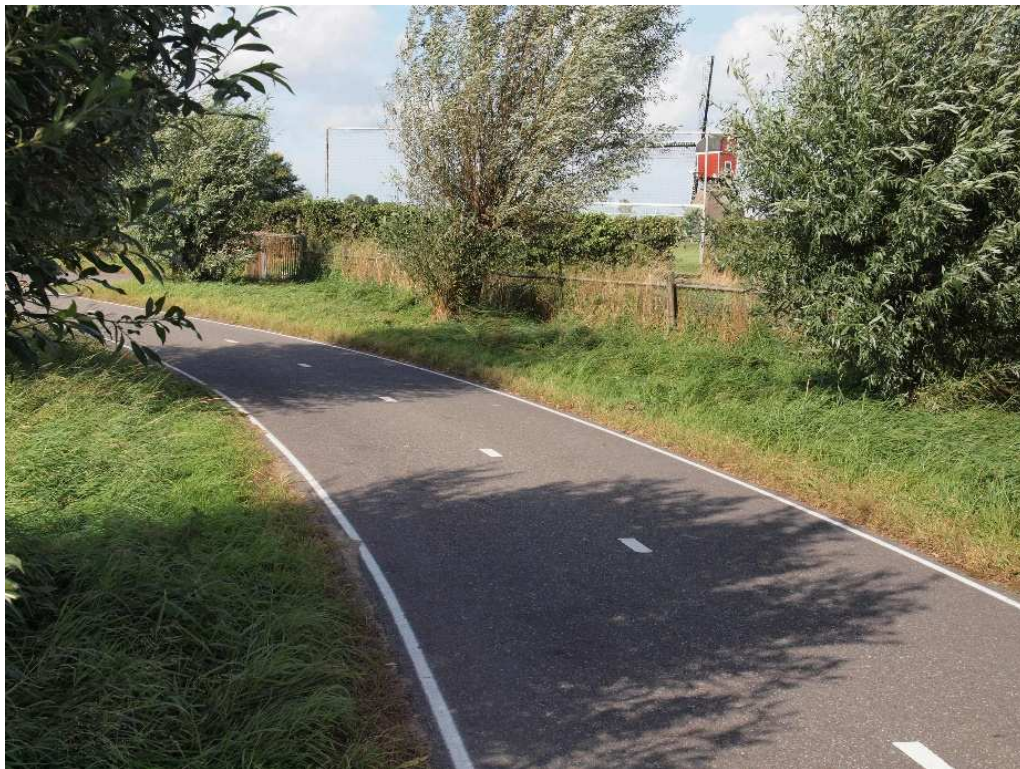
Duidelijke belijning aan de zijkant (en in het midden) van het fietspad.