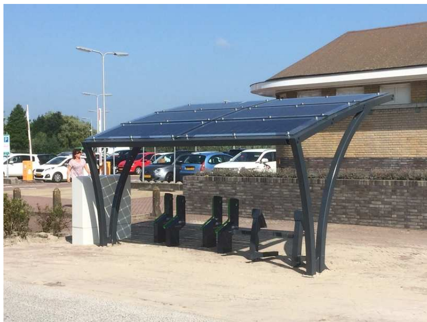
De nieuwe stalling met zonnepanelen in Boskoop.

De Fietsersbond is blij met alle initiatieven om het fietsen te bevorderen, en dus ook met deze innovatieve stallingen. Wel dient gezegd dat we verschillende verbeterpunten zien. We zullen deze verbeterpunten doorgeven aan de gemeente. We hopen dat die punten in latere versies worden meegenomen. In de tussentijd kunt u de stallingen zelf uitproberen (of gewoon bekijken) tegenover station Boskoop (bij het Floragebouw) of bij Wet 'n Wild aan de Zegerplas in Alphen.